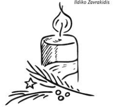
1. Advent: Die Umkehr wagen