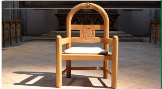
Der Bischofsstuhl in der Zeit der Sedisvakanz

Die Kathedra, der Bischofssitz, spielt eine besondere Rolle bei der Einführungsfeier. Als Kathedra bezeichnet man den Bischofsstuhl in einer Domkirche (Kathedrale). Sie ist seit alters her Symbol der Vollmacht eines öffentlichen Amtsträgers. Im Kirchenbau bekam die Kathedra einen herausgehobenen Platz beim Altar und steht auch für die Aufgabe des Bischofs, zu leiten und zu lehren.