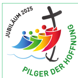
Logo des Heiligen Jahres 2025

Die Idee der Heiligen Jahre geht auf Papst Bonifaz VIII. (1235-1303) zurück, der für das Jahr 1300 ein besonderes Pilgerjahr ausrief. Zunächst fanden die Jahre in unregelmäßigen Abständen statt, seit Ende des 15. Jahrhunderts alle 25 Jahre. So nun auch im Jahr 2025. Papst Franziskus hatte im Mai 2024 das Jahr offiziell ausgerufen, zu dem mehr als 45 Millionen Pilger in Rom erwartet werden. Eröffnet wird das Jahr unter dem Motto „Pilger der Hoffnung“ am 24. Dezember 2024. Dann wird Franziskus die Heilige Pforte am Petersdom öffnen. Geschlossen wird sie wieder am 6. Januar 2026. Weltweit sollen Bischöfe am 29. Dezember 2024 einen Eröffnungsgottesdienst feiern und Bistümer spezielle Pilgerwege einrichten. In den Ortskirchen endet das Heilige Jahr bereits am 28. Dezember 2025.